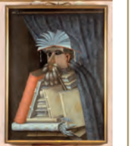
ジュゼッペ・アルチンボルド(右書) 1566年頃 油彩 キャンパス スクエアクロス テル城(スウェーデン)

2009年に開催された「だまし絵」展の続編として、「だまし絵Ⅱ 進化するだまし絵」が、8月9日(土)から開催されます。今回は現代アートまで枠を広げて視覚への挑戦をテーマとした作品を紹介しします。