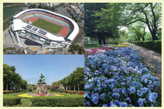
広大な公園緑地内にはスポーツイベントやコンサートなどが開催され、とどろきアリーナ、高校野球で使われる等々力球場、サッカーリーグ川崎フロンターレのホームスタジアムである等々力陸上競技場もあり、試合やイベント開催日は多くの人々でにぎわう。

等々力緑地 川崎中原区等々力1-1 ☎044-722-7722 等々力緑地管理事務所 (平日8:30~17:00 ※12:00~13:00はCLOSE。土・日・祝は等々力陸上競技場へ転送) 武蔵小杉駅から東急バス「溝02」「川131」「川133」「杉05」系統 「市営等々力グラウンド入口」下車