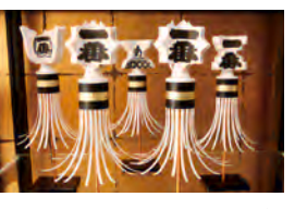
店内には20cmから最大1.3mまでさまざまな纏が飾られている。写真は20cmのモデル各1本1,300円

「お会式」の「万灯練供養」で行列の先頭を飾る纏(まとい)をモデルにしたミニチュアを作って販売している。纏は江戸時代の火消の威勢よさの象徴。「お会式」に詣でた記念に、江戸情緒の粋な一品はいかが？