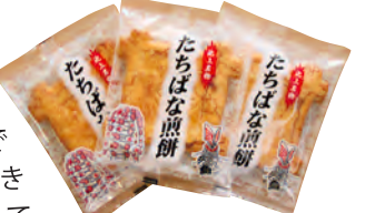
日蓮宗の宗教をかたどった「たちはな煎餅」。本門寺参詣の土産としても人気。1枚75円

昭和15年(1940年)ごろにこの地で創業した手焼きのあられとおかき、煎餅の店。現在は2代目が店の奥で作っている。あられとおかきは昔ながらの量り売りもしてくれるので、好みに応じて少量ずつ買えるのもうれしい。