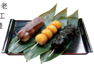
右から「ごま味噌・板わさ・こ八せいろ・真澄辛口生一本(長野)1合徳利のセット「ほろ酔いぎげん」1,800円、「こし餡とろーりあん団子」108円。

昭和13年(1938年)創業の老舗。ショーケースには、自社工場で作っている種類豊富な和菓子類が並ぶ。人気の団子は、1本で小腹を満たしてくれそうなほど大ぶり。この季節は、栗を丸ごと1個入れた大福や焼き菓子などがおすすめ。