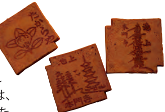
五重塔・橋(池上本門寺の紋章)の絵やお経などが書かれた瓦煎餅16枚セット 420円

昭和初期から池上本門寺正門のすぐ前で営む煎餅店。豊富な種類の煎餅が店の奥で手焼きされている。なかでも瓦煎餅は、一番おいしい状態を保つために店頭に出すタイミングにまでこだわっているという。