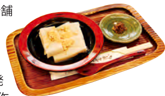
販売のほか、店内に喫茶室もある。写真は喫茶室メニューのくず餅450円(漬物付き)

宝暦2年(1752年)創業の老舗のくず餅店。初代店主が考案した元祖くず餅をいまも受け継いでいる。くず餅はでんぷん粉を1年以上発酵させて作る自然食品。手作りのため量産できないので、「お会式」の時はお早め。