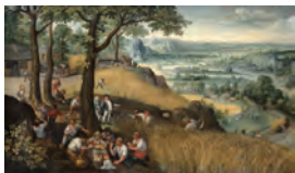
ルーカス・ファン・フルケンボルフ 《雲の風景(7月または8月)》 1585年 油彩・キャンパス

本展では、ウィーン美術史美術館の所蔵する絵画作品の中から「風景」に焦点をあてて選んだ70点の作品を展示。ヨーロッパにおける風景表現の歩みを、その誕生から展開に至るまで展覧していきます。