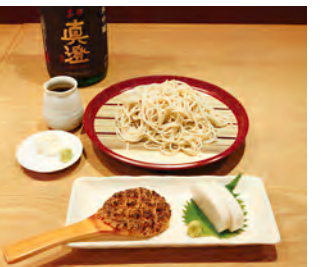
そば焼き味噌・板わさ・こ八せいろ・真澄辛口生一本(長野)1合徳利のセット「ほろ酔いぎげん」1,800円

石臼挽きの本格手打ちそばが味わえる店。自家製粉で二八と十割を選べる。「ちょっと一杯」にはちょうどいいつまみも充実しており、そばと一緒に昼から日本酒や焼酎を飲む客も少なくない。