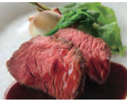
「二期倶楽部」ランチ

那須高原「二期倶楽部」バスツアーを抽選で3組6名さまにプレゼント!応募要項は読者プレゼントをご覧ください。