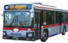
本年度導入される車両(例)