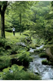
那須高原「二期倶楽部」

東急バスでは、季節に合った旬な企画旅行「東急バス紀行」をご提案しています。プレミアムバスツアーなら、高級感のある革張りシートでゆったりとした24人乗り、化粧室もついていますので安心してご旅行をお楽しみいただけます。 夏のおすすめプランとして「プレミアムバスでいく那須高原『二期倶楽部』」。夏空と風と森の自然を堪能できる那須高原「二期倶楽部」で森の散策などをお楽しみいただけます。このほかにも夏を満喫できるツアーをご用意しております。 詳細は、東急バスホームページをご覧ください。