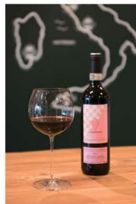
「リヴェルナーノ キャンティクラッシコ」 ¥3,200円、常時10種類程度そろうグラスワインは500円~