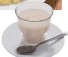
「甘酒(ホット)」 ¥520円 手作りの自然な味わい