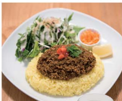
レモンをかけていただく「ドライキーマカレー」(サラダ、ドリンク付き) ¥1,080円

大田区矢口3-28-8 ☎ 03-6715-0986 平日11:30~15:30 (L.O.15:00)、 17:00~20:30 (L.O.20:00) 土11:30~20:30 日11:30~20:00 月休 武蔵新田駅徒歩12分