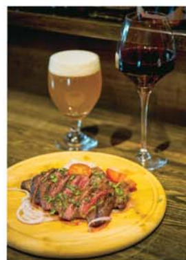
名物「宮崎牛のハラミ肉グリル」 ¥1,500円(税抜)、専用のグリルで焼き上げ、特製ポン酢や生さびでいただく ※写真は2人前

●東急多摩川線 矢口渡駅 Meatバル Don carne ミート ドン カルネ