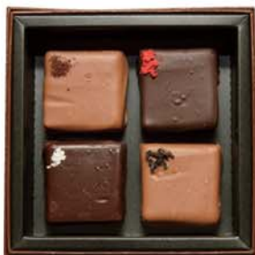
「新田コラボチョコレート」 ¥1,080円 左上から時計回りに、コーヒー・豆乳いちご・ほうじ茶・日本酒味のトリュフチョコ、日本酒チョコには「北嶋屋」の「新田浪漫」を使用。 ※2月中旬(予定)までの期間限定販売