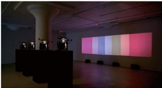
ホール・シャリッツ《Shutter Interface》1975

展示、上映、ライブ・パフォーマンス、トーク・セッションなど、さまざまな見せ方で映像分野の活性化を領域横断的に目指す映像祭。今回は世界を光で照らし出すと同時に、見えないものを浮かび上がらせる映像の多様なあり方から現在を考える。