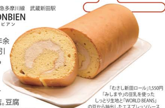
「むさし新田ロール」 ¥1,550円 「みしまや」の豆乳を使ったしっとり生地と「WORLD BEANS」の豆から抽出したエスプレッソムースが作る、甘さひかえめ優しい味わい

この地で40年余り、二代目に引き継がれる手作りの確かな味で、まちに溶け込む洋菓子店。豆腐屋やコーヒー豆専門店、酒屋など、武蔵新田商店会の他店舗とコラボした逸品で、武蔵新田のまちを味わってみて。