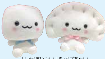
「しゅうまいくん」、「ぎょうざちゃん」ぬいぐるみ各972円