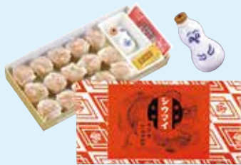
「ひょうちゃん」のしょう油入れも人気「昔ながらのシウマイ」(15個入)620円