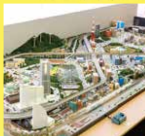
Nゲージパーク 20分200円

川崎市宮前区宮崎2-10-12 ☎ 044-861-6787 10:00~16:30(入館は16:00まで) 木休(祝日の場合は翌日休) 宮崎台駅直結