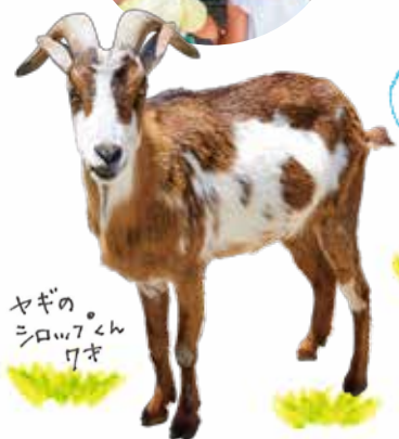
ヤギのシロアちゃん 7才