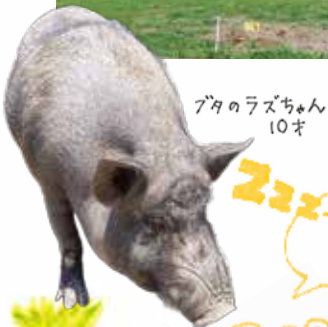
ブタのラズちゃん 10才

10:00~16:30(入園は~16:15)、「どうぶつのおやつ」は~15:30 ※9月以降は~16:00(入園は~15:45)、「どうぶつのおやつ」は~15:00 入園料 大人250円、こども(3才から中学生)200円 こどもセット券(こども1名の動物園入園とポニー乗馬のセット券、販売は~15:30 ※9月以降は~15:00)500円