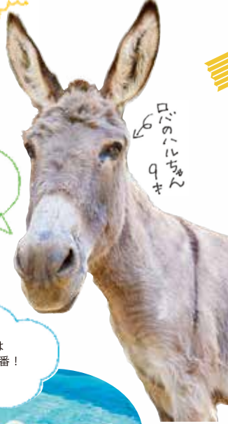
ディスコちゃん 9才