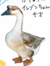
ガチョウのイレブンちゃん 4才