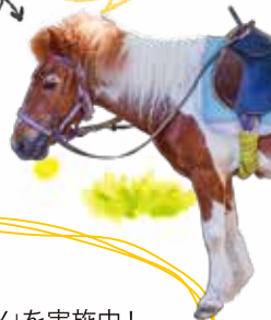
ポニーのランくん 24才