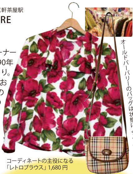
コーディネートの主役になる「レトロブラウス」1,680円

世田谷区三軒茶屋1-32-8 ☎なし 11:00~22:00 無休 三軒茶屋駅徒歩3分