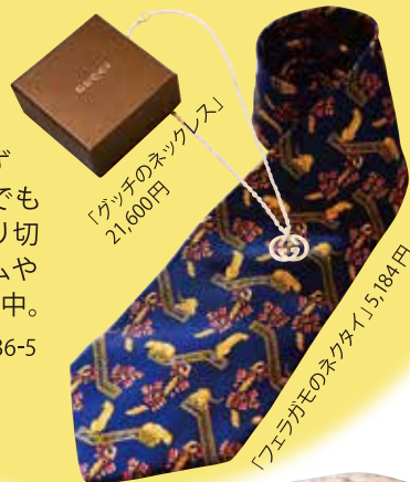
「グッチのネックレス」 21,600円