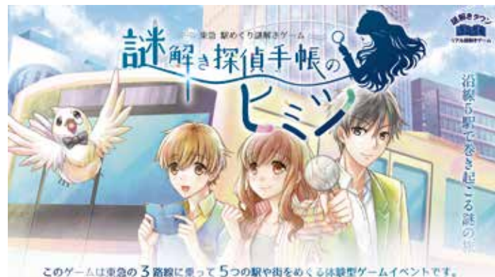
このゲームは東急の3路線に乗って5つの駅や街をめぐる体験型ゲームイベントです。

開催期間 3月31日(日)まで 開催場所 東急線トライアングルチケットの自由周遊エリア内 参加費用 1,500円(税抜) ※トライアングルチケットなどの乗車運賃別途。 想定所要時間 3時間～(10:00～20:00)