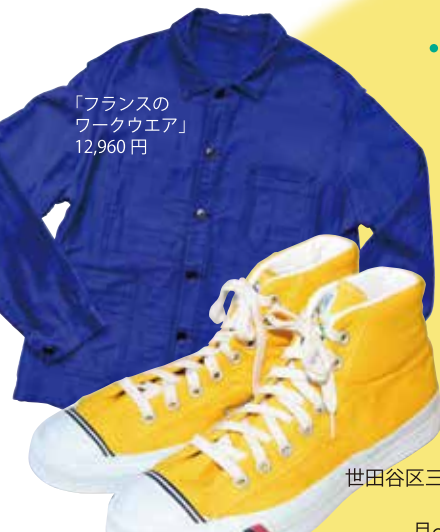
デッドストックの「プロケツスのスニーカー」 12,960円