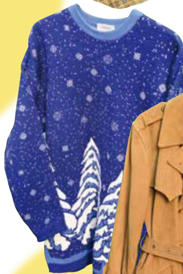
「ヴェルサーチのニット」 12,900円