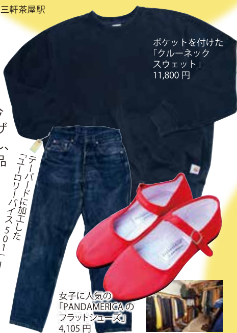
ポケットを付けた「クルーネックスウェット」 11,800円

世田谷区三軒茶屋1-36-3 ☎03-3795-0770 月~金16:00~24:00 土日祝14:00~24:00 無休 三軒茶屋駅徒歩3分