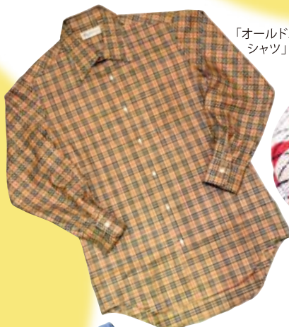
「オールドバーバリーのシャツ」16,200円