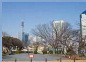
井伊直弼の官位「掃部頭(かものかみ)」が公園の名の由来