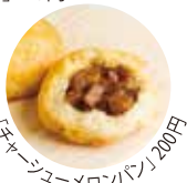
「チャーシューメロンパン」200円