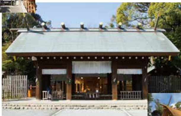
伊勢にあったそのままの姿での移築は全国でも珍しい

港が開かれた横浜の守り神として1870年に現在の地に創建された神社。「関東のお伊勢さま」として地元の人々に親しまれている。2020年の創建150年に向けた記念事業として、伊勢神宮から旧社殿の一つを丸ごと1棟譲り受け、新たな本殿として2018年に移築した。