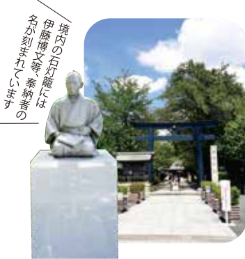
境内の石灯籠には、伊藤博文等、奉納者の名が刻まれている。