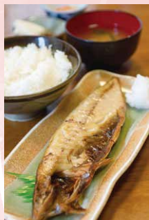
脂がのった「さば焼き定食」750円は、男性に根強い人気

大田区北千束1-49-3 ☎ 03-3724-5945 11:30~14:00 17:30~22:30 日・祝休 大岡山駅徒歩1分