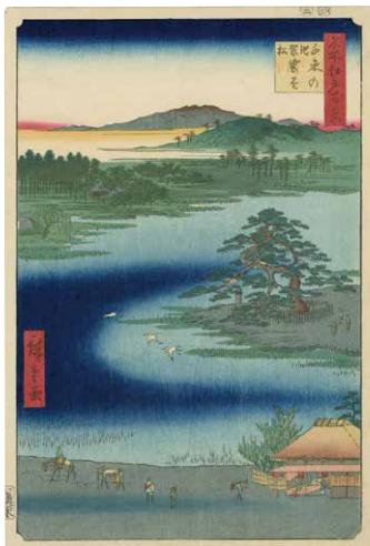
『名所江戸百景 千束の池袈裟懸松』

大田区南千束2-14-5(洗足池公園) ☎ 03-3726-4320(調布地域基盤整備事務所) 洗足池駅徒歩2分