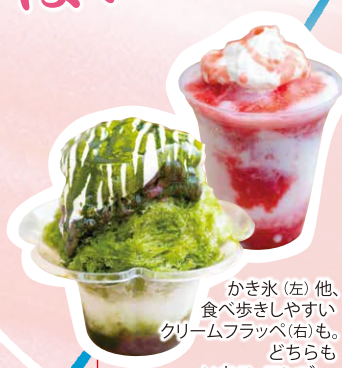
かき氷(左)他、食べ歩きしやすいクリームフラッペ(右)も。どちらもいちご、マンゴー、抹茶の3種類各500円