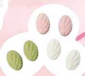
「ハーブのらくがん」はローズマリーなど3種。各1袋360円