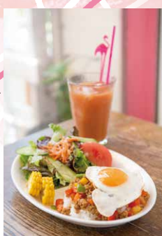
ランチはドリンク付きで980円

大田区南千束3-4-9 ☎ 03-3728-7282 10:00~19:30 日~火休 大岡山駅徒歩4分