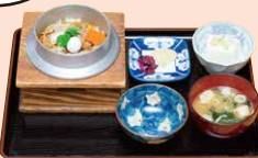
「温泉釜飯セット」900円