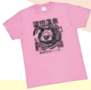
大人気のオリジナルTシャツ。1,200円〜