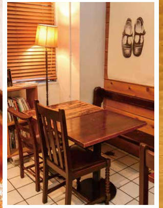
居心地の良さにリピーターになる人も。 メニューには、オーナーの地元、岡山から 取り寄せた野菜などを使っている