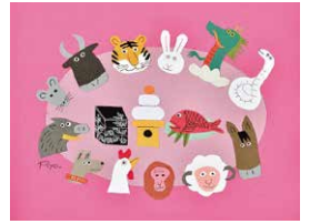
「十二支のしんねんかい」表紙原画 2012年 切絵

横浜にゆかりの深い画家・イラストレーター柳原良平氏の作品を紹介する。絵本「十二支のしんねんかい」の原画など、お正月に合わせた、おめでたくて楽しい作品が展示される。