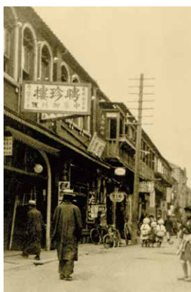
明治～大正初期ごろの聘珍樓