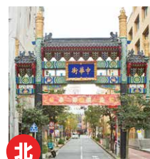
玄武門(げんぶもん)