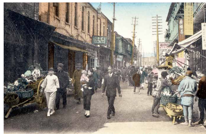
1920年（大正9年）ごろの中華街大通り