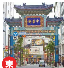
朝陽門(ちやうようもん)

1955年2月、戦後復興の願い を込めて初代が完成し、現在は 2代目。この門に「中華街」と 書かれたことにより、正式名称 として知られるようになった。