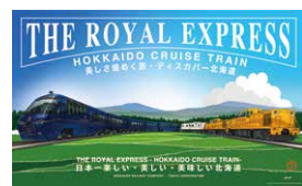
列車デザインイメージ ©ドーンデザイン研究所

東急株式会社はJR北海道と協同で、観光列車「THE ROYAL EXPRESS」を北海道内で運行します。北海道の大自然とその恵み、大地に根ざした人々とのふれあいを通して、お客さまの記憶に残る最高の「美しさ、煌めく旅。」へご案内します。