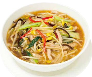
「サンマー麵」1,100円(税・サービス料別途)