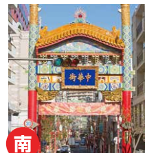
朱雀門(すざくもん)