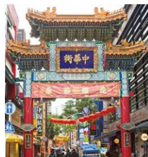
善隣門(ぜんりんもん)

戦後、焼け野原になった中華街に、復興の証として建てられたのが 中国の伝統的な建築様式の門「牌楼」。まず善隣門が1955年に 完成し、そこから10基の牌楼が建立されました。その中でも東西 南北にある4基は街の守り神として大きな意味を持っています。