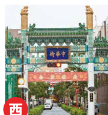
延平門(えんぺいもん)