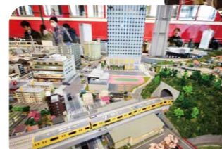
京急線沿線の街並みが再現されたジオラマ