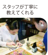
スタッフが丁寧に教えてくれる