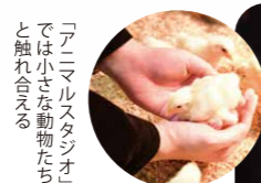
アミューズメント施設と触れ合える

複数の展示空間で構成されたジャングルのような施設内で、カピバラやフクロウ、ミニアキアットなど、日常では出会えない動物たちを間近で見ることが出来る。極寒体験や4Dシアターなどのコーナーも充実。