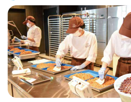
製造過程がガラス越しに見られる

人気商品「クルミッツ」の製造工程を見学しながらスイーツを楽しめる鎌倉紅谷の新業態。おいしさだけでなく、五感を使って楽しんでほしいという思いの詰まった店内では、キャラメル作りからフィルムラッピングまで一連の工程が見学できる。