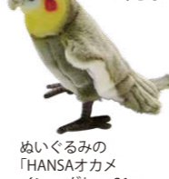
めいぐるみの「HANSAオカメインコグレー21」3,190円(税込)