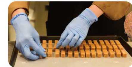
生キャラメルの製造工程が見られる

人気の菓子「横浜レンガ通り」を製造する「ウィッシュボン」が手掛けるキャラメル専門店。店内の工房では、銅鍋での焼き上げからカット作業、包装まで、生キャラメルを作る様子が見られる。