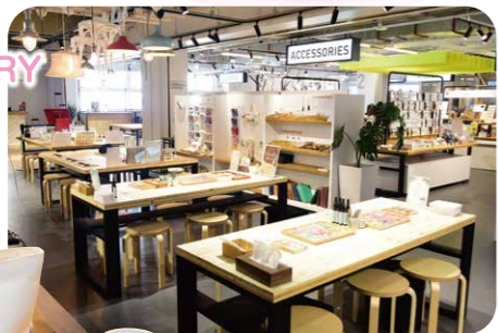
ワークショップの作業スペース

横浜中央郵便局別館をリノベーションした複合型体験エンターテインメントビル。B1階~4階ではワークショップや展示、アミューズメント、グルメがそろい、屋上ではフットサルやバスケットボールができる。