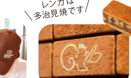
レンガは多量見焼です! 外観の赤いレンガはクルミッツと同じサイズ。隠れリスを探してみてください

☎045-263-9635 ファクトリー11:00~19:00、ショップ&カフェ11:00~21:00