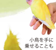
小鳥を手に乗せることもできる