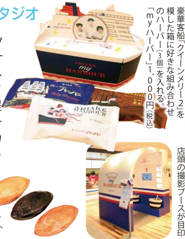
豪華客船「クーンメルリー2」のハバードに好きな組み合わせの「myハーバー」を入れる

特製シロップが塗られた「焼きたてハーバー」。左からロイヤル280円、ガトーショコラ200円、ダブルマロン200円