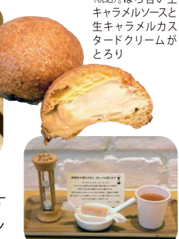
行列のできる生キャラメルのテイストは毎日11:00~14:00~16:00~の3回