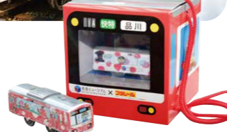
「マイ車両工場」では自分だけのオリジナル車両の工作体験ができる。体験料1,000円(税込・予約制)

見て楽しい! 作ってうれしい! 食べておいしい! 知識が広がる、みなとみらいエリアの注目施設