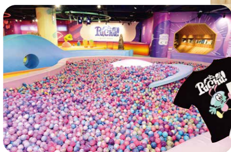
絵本スペースは大きな万華鏡のよう

「小さな宇宙」をテーマにしたキッズテーマパーク。ワンフロアに12のプレーエリアが入り、音や振動を感じながら体を動かして遊べる。保育士の資格を持ったスタッフが在室しているのも安心。離乳食の販売も行っている。