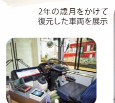
2年の歳月をかけて復元した車両を展示

「本物」を見て、触れて、楽しむ」をコンセプトに、2020年1月に京急グループ本社1階にオープン。京急線沿線の風景を再現した巨大ジオラマを中心に、1978年に引退した京急車両「デハ230形・デハ236号」や、運転体験のできる「鉄道シミュレーション(有料)」などが配置されている。