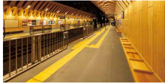
センサー付固定式ホーム柵