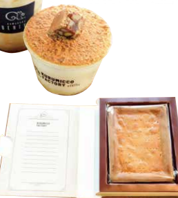
ミニサイズのホールクルミッツが作れるワークショップ3,000円(予約制)